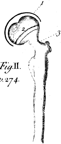
Fig. II. p. 274.